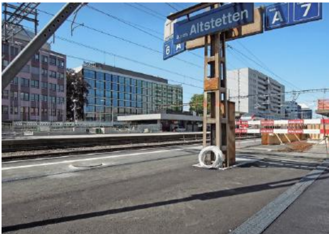
Die Vorarbeiten für die Passerelle über die Gleise haben schon begonnen.

Diese Frequenz dürfte sich in den nächsten Jahren weiter erhöhen. Erst im vergangenen Jahr wurde das Areal Westlink, das 155 Wohnungen, Gewerbe und Gastronomie beheimatet, fertiggestellt. Damit aber nicht genug: In drei Jahren soll beim Altstetterplatz die Endhaltestelle der Limmattalbahn in Betrieb gehen. 2022 erfolgt die planmässige Eröffnung des Eishockeystadions nahe dem Bahnhof. Weitere Wohn- und Bürokomplexe im angrenzenden Zürich-West dürften den Pendlerstrom zum und vom Bahnhof Altstetten künftig ebenfalls verstärken. Lina Giusto