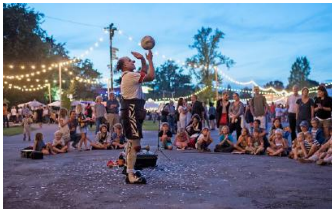
Besucher verfolgen die Vorstellung eines Strassenkünstlers auf der Landiwiese.

Es ist nicht das erste Mal, dass die kreativen Köpfe hinter dem Festival mit Aktionen von sich reden machen. Mit dem Einsatz von Stromsparlampen und rezyklierbarem Geschirr sowie dem getrennten Entsorgen von Abfällen gehört das Theater Spektakel mittlerweile zu den nachhaltigsten Anlässen der Schweiz. In den letzten Jahren bemühten sich die Veranstalter, die Zugänglichkeit der Veranstaltungen für Menschen mit Behinderungen zu verbessern. Vergangenes Jahr erhielt das Festival die Auszeichnung «Kultur inklusiv» von Pro Infirmis, der grössten Fachorganisation der privaten Behindertenhilfe in der Schweiz. Lina Giusto