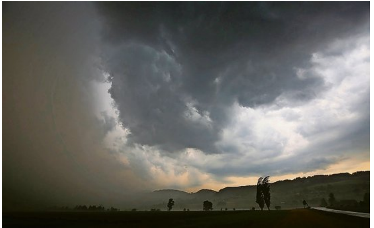
Der Hagelzug über Mühlethurnen kostete die GVB 2,6 Millionen. Hätte der Hagelsturm 16 Kilometer nördlich gewütet, hätten die Schäden 360 Millionen Franken betragen.

Stark eingebrochen ist das Kapitalergebnis. Dass es dennoch positiv abschliesst, sei dem hohen Immobilienbestand zu verdanken, hiess es gestern an der Bilanzmedienkonferenz. So liegt der konsolidierte Gewinn mit 7,6 Millionen Franken nur leicht unter dem Vorjahr. Fast die Hälfte des Gewinns, 3,6 Millionen Franken, stammt von der GVB Privatversicherungen. Damit konnte die Tochtergesellschaft, die freiwillige Zusatzversicherungen anbietet, bereits im dritten Jahr ihres Bestehens einen substanziellen Gewinn erzielen